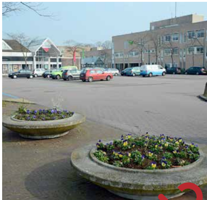
Het huidige plein