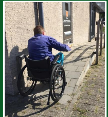
Drempelvrij Stede Broec

Maak een foto van een situatie of geef 'drempels' aan de werkgroep toegankelijk door via toegankelijk@stedebroec.nl .